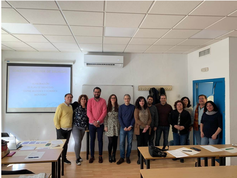
Comisión Técnica de Igualdad

y transparencia; participación ciudadana, educación, festejos y comercio; medio ambiente, ocio, juventud y deporte.