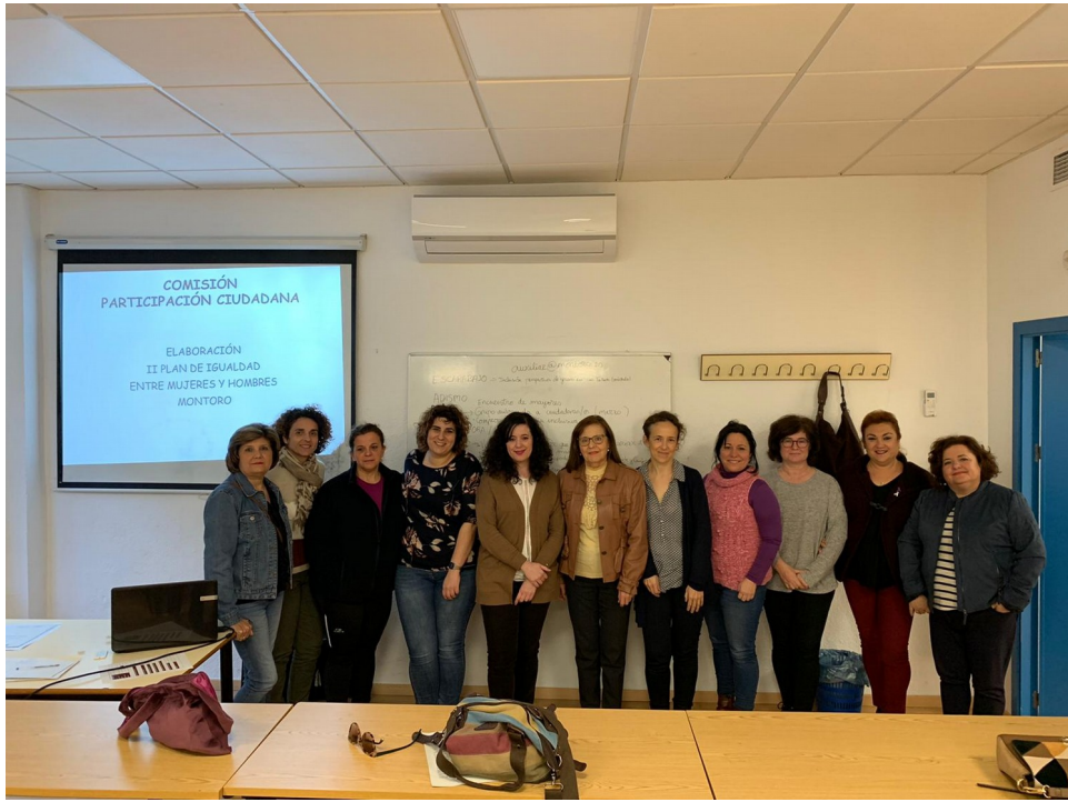
Comisión de Participación Ciudadana