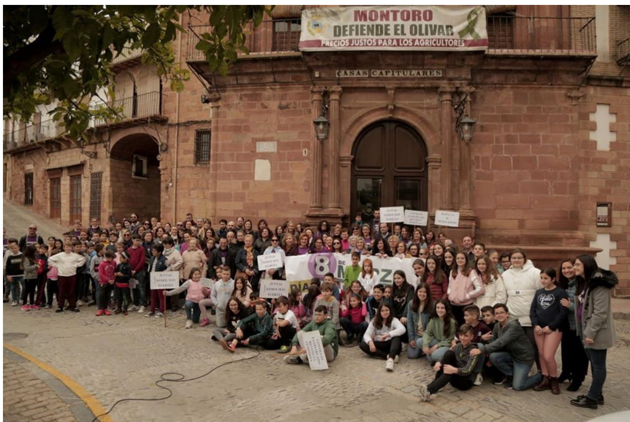
Día Internacional de la Mujer. 8 de Marzo del 2020

Tras este recorrido legislativo que fundamenta la constitución del presente Plan de Igualdad y haciendo hincapié en las obligaciones que como actores públicos y privados tenemos en la consecución de la igualdad real entre mujeres y hombres, se impulsa el cuerpo del presente plan, así como la programación de las acciones para el período 2020-2023.